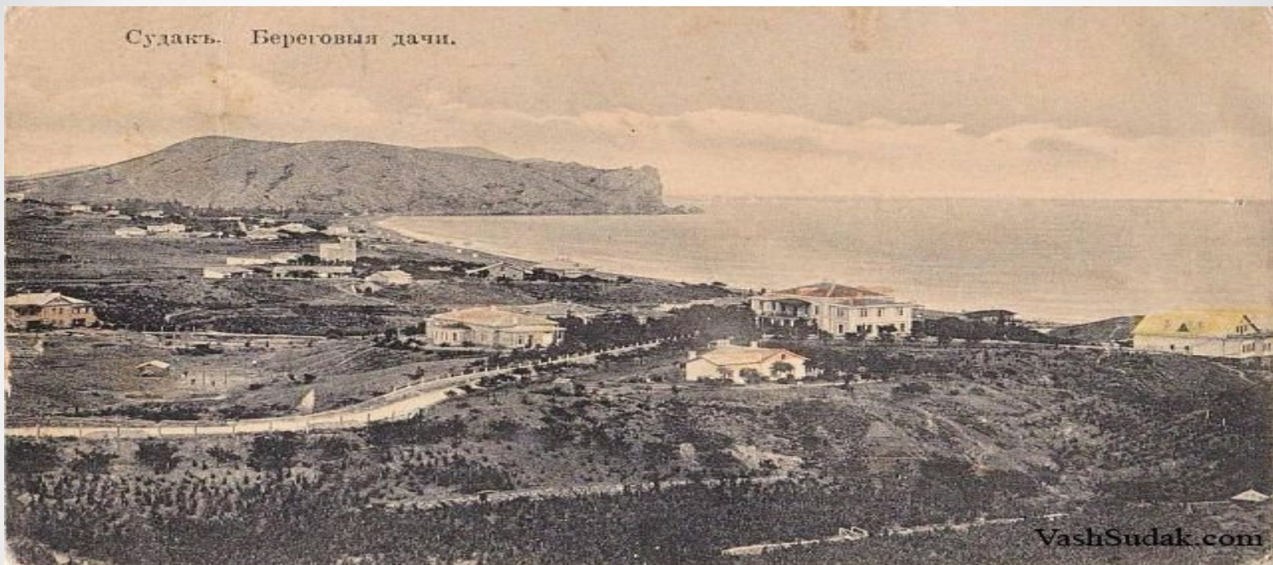
Судакъ. Береговья дачи.