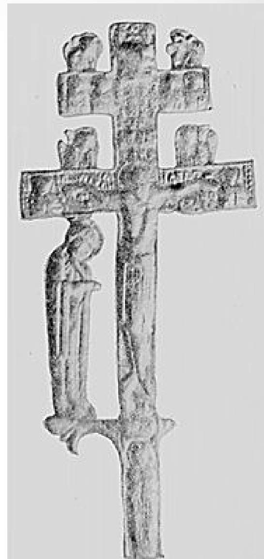
Русский крест XII-XIII вв.